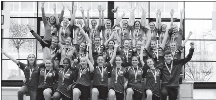
Damen U20: Küssnacht vor Buochs und Hausen am Albis.

Die erste Liga der Damen wurde nach dem Rückzug von Wettingen in einer Neunergruppe gespielt. Die Bernerinnen aus Urtenen dominierten die diesjährige Meisterschaft nach Belieben. Mit 31 Punkten aus 16 Spielen gaben sie nur einen einzigen Punkt ab. Der dritte Titel in den letzten vier Jahren war Tatsache. Dahinter sicherten sich die Aargauerinnen aus Dottikon (23) und Wolfenschiessen (21) die weiteren Medaillen. Wolfenschiessen konnte wie im Vorjahr den Innerschweizer Meistertitel feiern. Im Mittelfeld rangieren Willisau (17), Menznau (17) und Unterkulm (16). Pfäffikon (10) und Küssnacht (8) sicherten sich den Klassenerhalt klar. In die 2. Liga steigen die