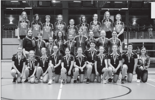
Mädchen U16: Schwyz vor Buochs und Grosswangen.