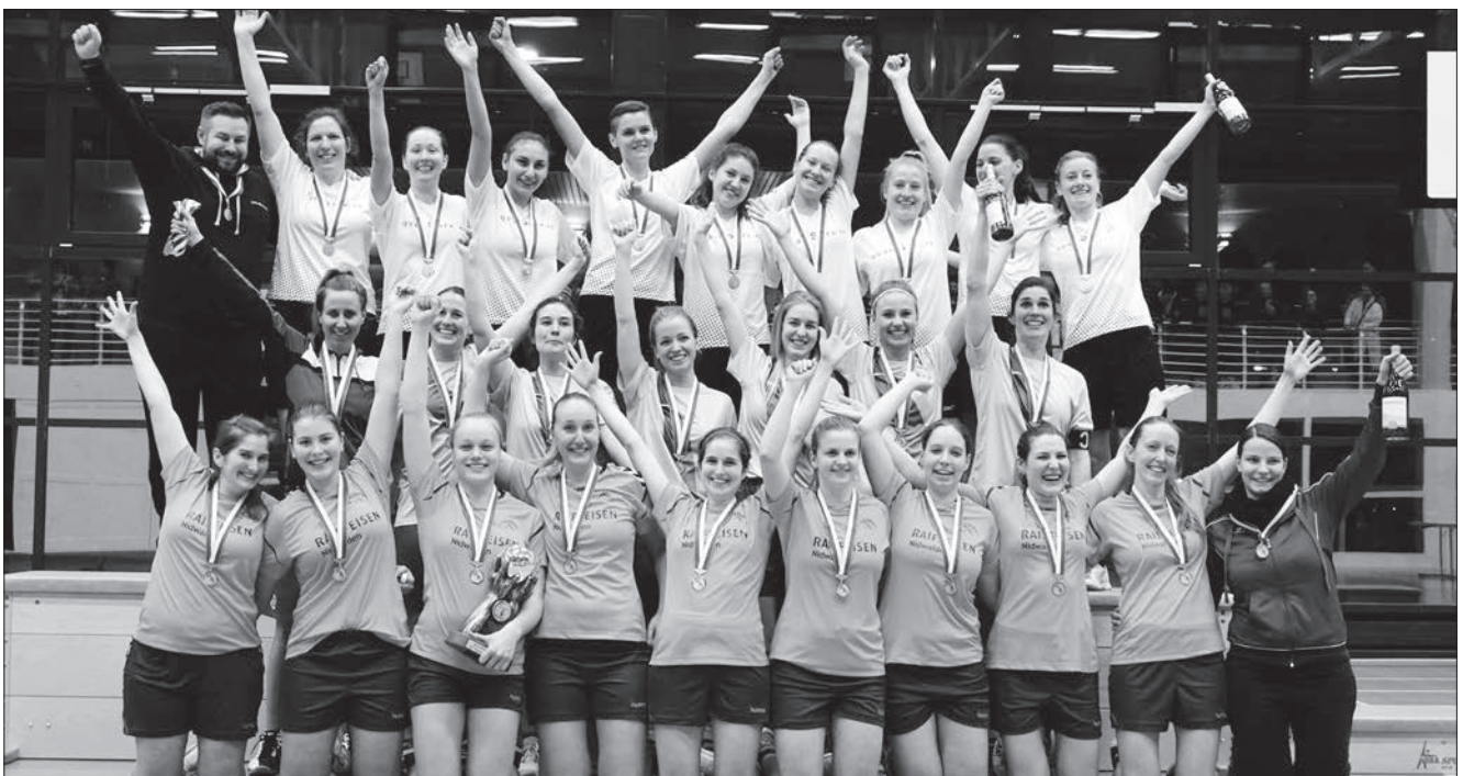
Damen: Urtenen BE (hinten), Dottikon AG (Mitte) und Innerschweizer Meister Wolfenschiessen (vorne).