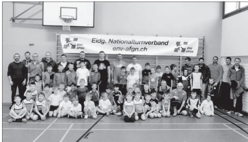
Teilnehmende, Betreuer und Kursleitende freuen sich über einen gelungenen Tag.

Bericht: Esther Peter