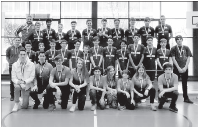
Knaben U16: Menznau vor Küssnacht und Rickenbach.