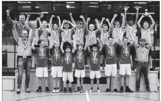
Knaben U14: Menznau vor Buochs.