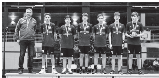
Herren U20: Menznau.