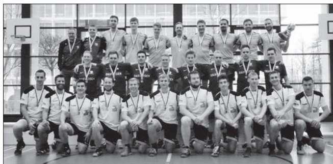
Herren: Innerschweizer Meister Wikon (hinten), Menznau (Mitte) und Bözberg AG (vorne).

Bericht: Daniel Schneider