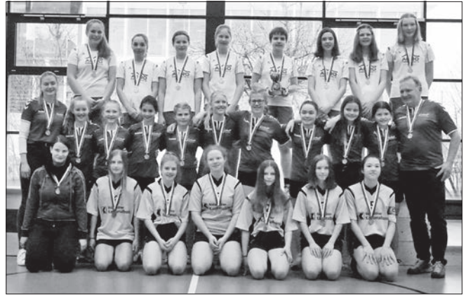
Mädchen U14: Schwyz vor Menznau und Wolfenschiessen.