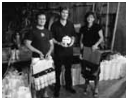
Erster bis dritter Rang, Mixed

Für die Mixed-Meisterschaft 2006/2007 haben sich leider nur sieben Mannschaften angemeldet. Es konnte aber eine interessante und spannende Vorrunde gespielt werden. Die Vorrunde dauerte bis anfangs März. Jede Mannschaft musste sechs Spiele bestreiten.