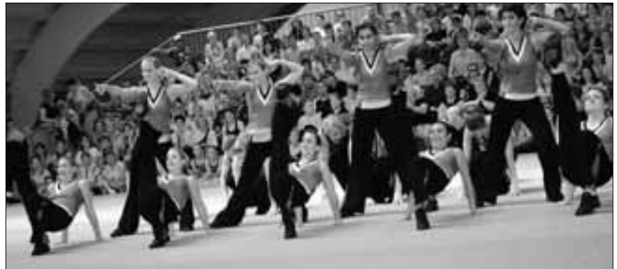
Team Aerobic, BTV Luzern

Beim einteiligen Vereinswettkampf können Aktive wie auch die Frauen/Männer ihren Wettkampf zusammenstellen und aus