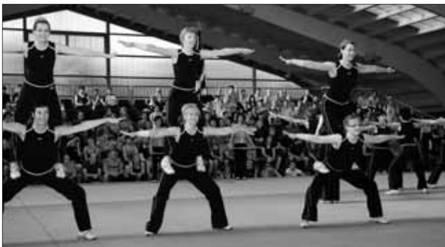
Team Aerobic, Willisau 2, Turnfestsieger