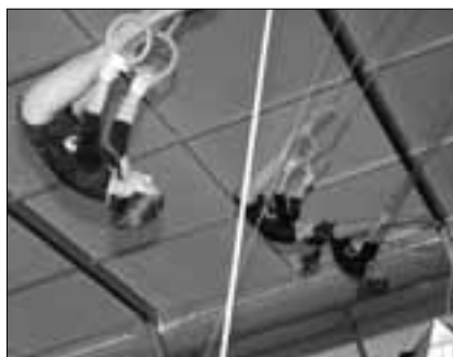
Gerätekombination, BTV Luzern

sich die Wettinger jeweils die Bestnote 10.00, somit die Maximumpunktezah von 30.00 und wurden daher verdient Turnfestsieger. Mit nur 0.66 Punkten Rückstand schaffte es der STV Willisau auf den guten dritten Platz. Der STV Willisau war besonders im 2. Wettkampfteil (HO, 400 m, KUG) sehr stark. Hier holten sie sich eine blanke 10.00. Vom Turnverband Luzern, Ob- und Nidwalden eroberte sich zudem der STV Neuenkirch mit 28.26 Punkten mit Platz 8 eine Top-Ten-Rangierung, genauso wie der STV Wolhusen mit Platz 9 und nur gerade 0.12 Punkten