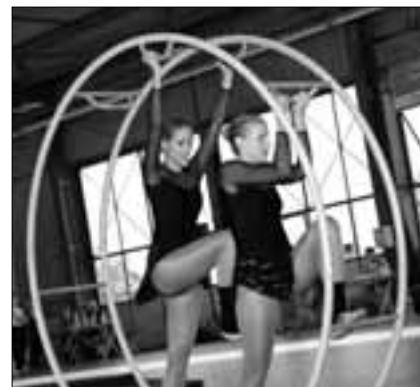
Gerätekombination, Rhöndrad, Buochs

Aus unserem Verbandsgebiet klassierte sich der STV Altbüron im tollen 13. und die Aktivriege des STV Malters den 14. Rang. Eine kleine Überraschung gelang auch dem STV Kerns, der für seine sehr gute Barren-Show eine 9.64 erhielt und mit einer Totalpunktezah von 27.46 auf den 18. Platz kam.