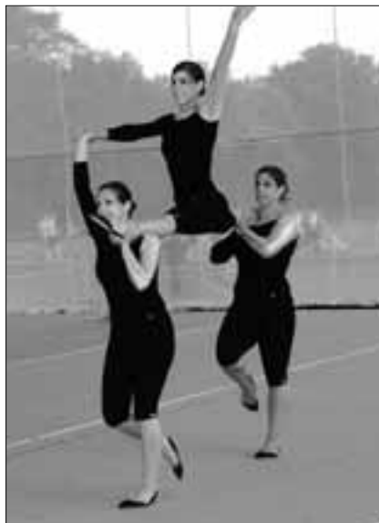
Gymnastik, Jugend, Neuenkirch

Ein grosser Teil der Vereine wählte ihre Disziplinen aus dem Frauen-Männer-Wettkampf « Fit & Fun ». Dieser besteht aus den drei Wettkampfkategorien Kombiläufe, Prellen und Werfen sowie Fit im Team. Jede dieser Kategorien beinhaltet zwei Disziplinen, die hintereinander zu absolvieren