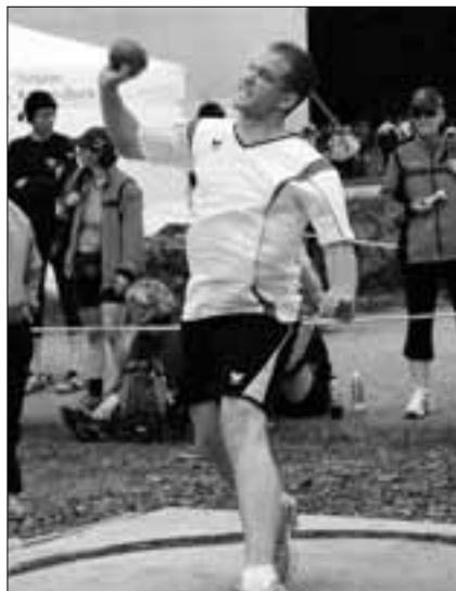
Kugelstösser des Turnvereins Ennetbürgen mit vollem Einsatz dabei.