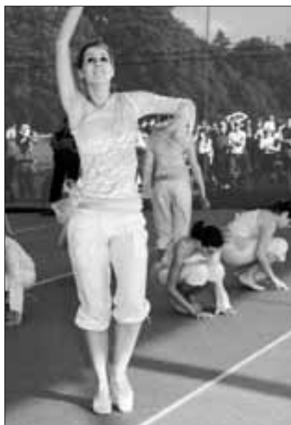
Gymnastik, Jugend Emmenstrand

In der Gymnastik (ohne Handgerät) konnte der BTV Luzern dank seinem dritten Rang eine Auszeichnung mit nach Hause nehmen und klassierte sich mit 9.45 Punkten knapp vor dem ESV FR Eschenbach auf Rang vier mit 9.36 Punkten.