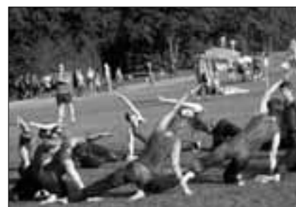
Gymnastik, STV Neuenkirch

Der DTV Oberrüti sicherte sich mit einer Punktezah von 29.50 den ersten Rang in der 3. Stärkeklasse.