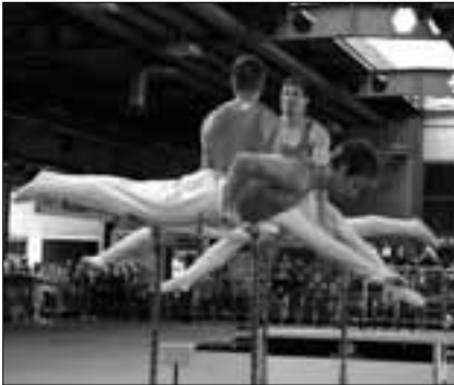
STV Kerns beim Barrenturnen mit der tollen Note von 9.64