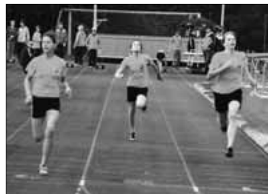
STV Ballwil, Zieleinlauf

In der Kategorie Männliche Jugend B siegte Buchrain mit 9'099 Punkten deutlich vor Ballwil. Aus-