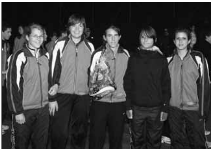
Die Siegerinnen vom STV Hitzkirch

deuten sollte. Mit klarem Rückstand belegte Wolhusen den zweiten Rang.