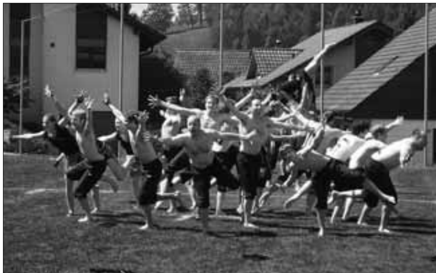
Sulz bezauberte mit einer ideenreichen Grossfeldgymnastik und siegte in dieser Sparte

Die Rickenbacher Turner bewiesen mit zwei hochstehenden Vorführungen ihre gute Form und durften wiederum auf das oberste GYM-DAY-Treppchen steigen. Roggliswil war nach dem ersten Durchgang noch nahe am