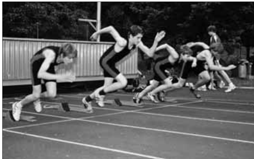
Der STV Sursee am Start

Die Kategorie Frauen dominierte der Gast aus Boswil klar. Mit 9'035 Punkten gelang den Frauen aus Boswil ein Resultat, welches die Qualifikation für den Final be-