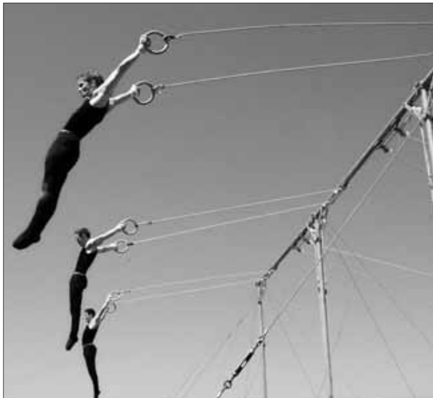
Der BTV Luzern schwang oben auf und kehrte mit einem Doppelsieg nach Hause – Sieg bei den Sprüngen und an den Schaukelringen

Hauptsponsoren: Bodum Triengen, Huber Franz Grosswangen, Kunz Sport Willisau, RWD Schlatter Roggwil, SWISS LOS Sport-Toto