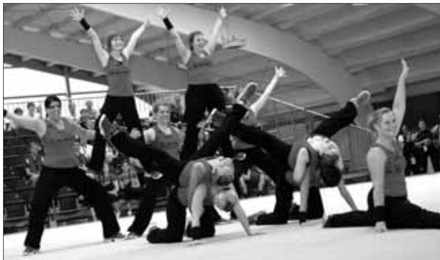
Vereinswettkampf dreiteilig, Team Aerobic, Willisau 1