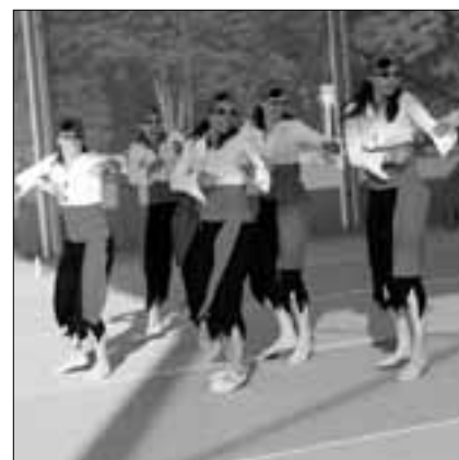
Gymnastik, DTV Emmenstrand

sind. Aus unserem Verbandsgebiet wählten acht Turnerinnen aus Geuensee diese Sparte und landeten mit 6.96 Punkte auf dem 26. Rang.