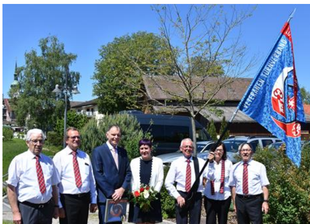
Landsgemeinde (2019 mit Fahnenweihe in Inwil)