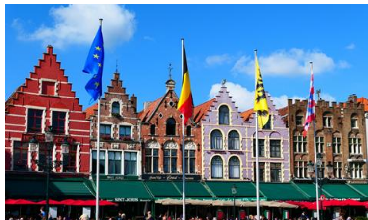
Veteranenreise (2019 nach Belgien)