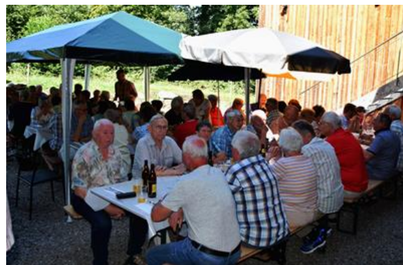
Sommer- plausch (2021 in Neuenkirch)